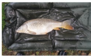
Stief in de wagen vangen

Fuck, ik zat vast. Nee toch..., vlieg de slip een beetje meer open goet, het schepnet over mijn hoofd gesmeeten en het ploeren kon beginnen. Gelukkig kon ik mezelf uit deze