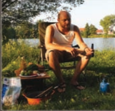
1 Beem je tijd om in kookmodus te geraken

vertrouwt. Ingetruwe Maar, ontzettend lekker en je hebt er enkel een pot voor nodig. De grootste troef is echter dat de reegjes ook nog eens als uillem diepgevoortbrekend karpersas kunnen worden gebruikt. Get on the Scampi!