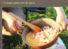
4 Scampi gaart met de spices