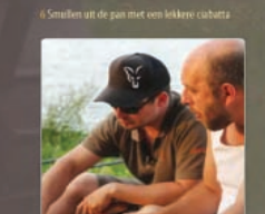
6 Smullen uit de pan met een lekkere ciabatta