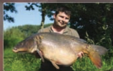
7 Hang de laatste scampi aan je haai :)

Waar? Voor 2 personen: 1 ciabatta, een scheut olijfolie, verse gember (3 cm), 3 trossen look, 3 pikante pepertjes, een bosje peterselie, 2 limoenen en een halve kilo scampi's