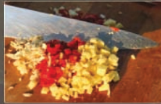
3 Kruiden fijnhakken