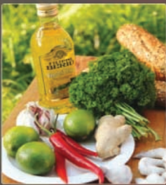
2 Smaakbom met vijf kruiden