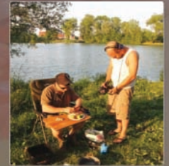
8 Pot en Pan landt op Camping Cosmos

Waar? Voor 2 personen: 1 ciabatta, een scheut olijfolie, verse gember (3 cm), 3 trossen look, 3 pikante pepertjes, een bosje peterselie, 2 limoenen en een halve kilo scampi's