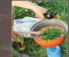
5 Limoensap en peterselie op het einde toevoegen