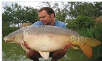
Het rozenrood van de vissen hangt rond de dertig pond!