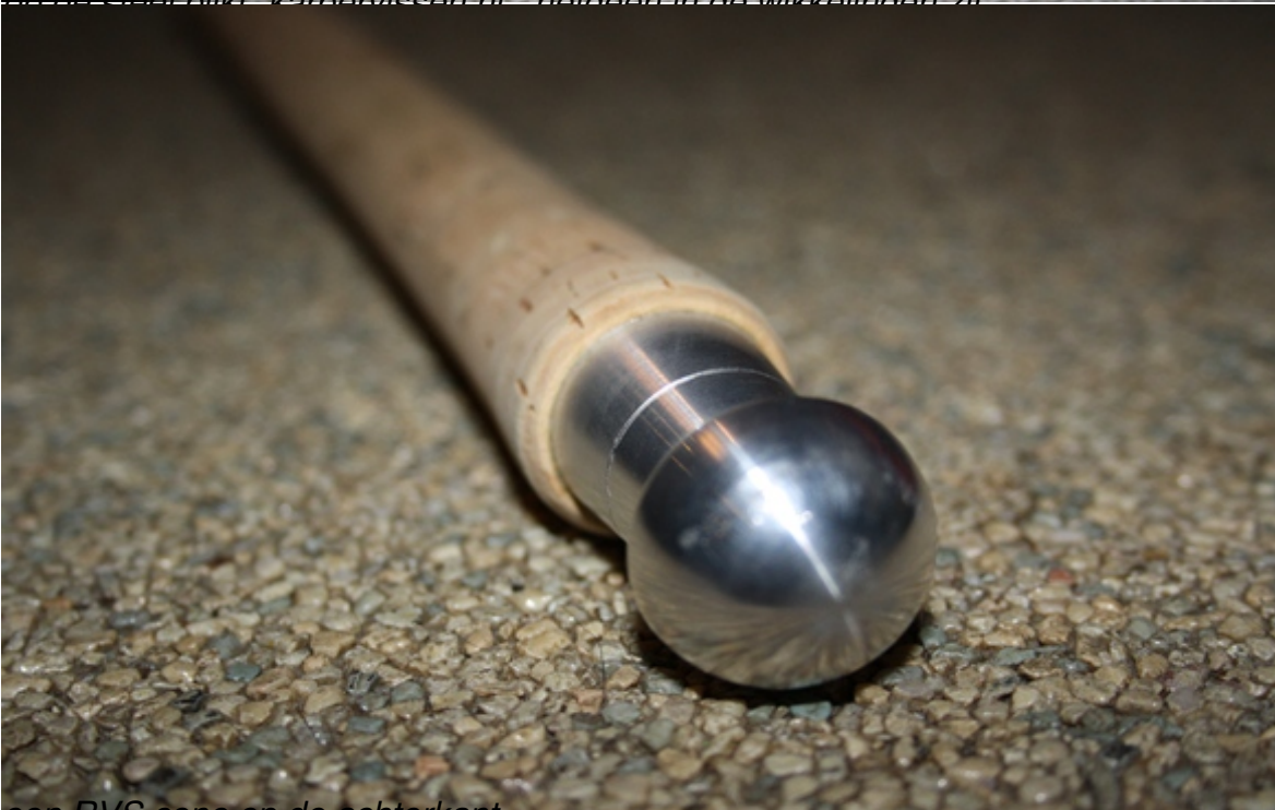
een RVS cone op de achterkant