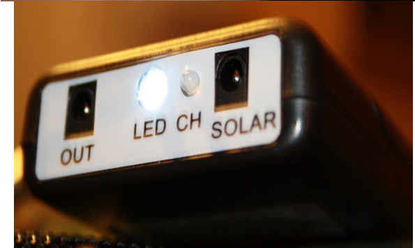
5. Het licht van de LED CH is het meest gebruikte telefoonlicht. Het is de beste keuze voor een