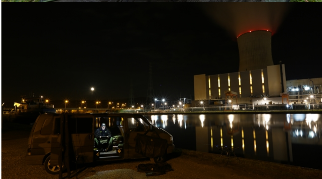
Gedetailleerd beeld: nieuwe generatie visvinders