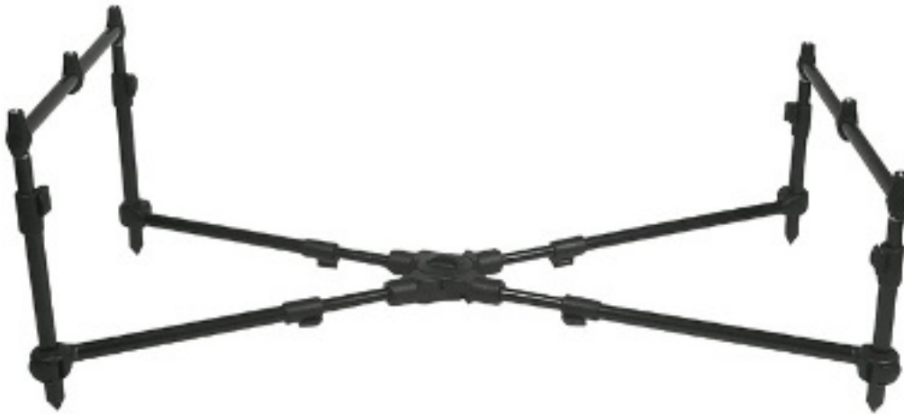
Een lichtgewicht rodpod van Fox