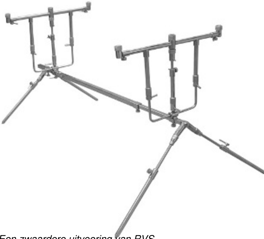
Een zwaardere uitvoering van RVS